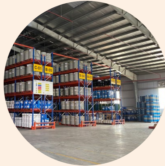
Dịch vụ kho bãi Warehouse services