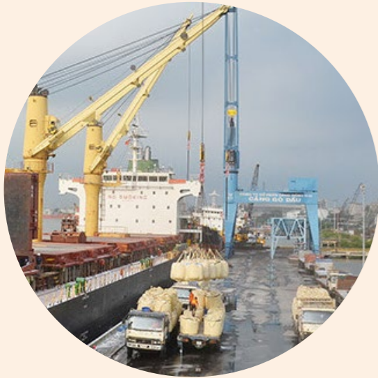
Xếp dỡ hàng tổng hợp Loading/discharging general cargo