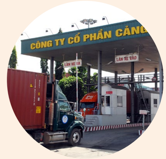
Dịch vụ logistics, giao nhận door-to-door Logistics & door to door services